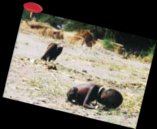
La bambina e il corvo La fotografia è di Kevin Carter, scattata nel marzo del 1993 in Sudan. Obiettivo: sensibilizzare il mondo sui temi della carestia e della fame.