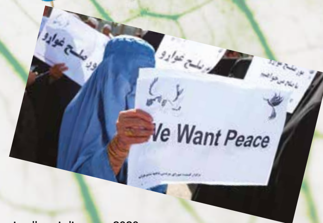
Afghanistan, sostegno ai colloqui di pace - 2020