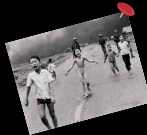
Phan Thj Kim Phúc ritratta da bambina in una fotografia scattata l'8 giugno 1972 durante la guerra del Vietnam.