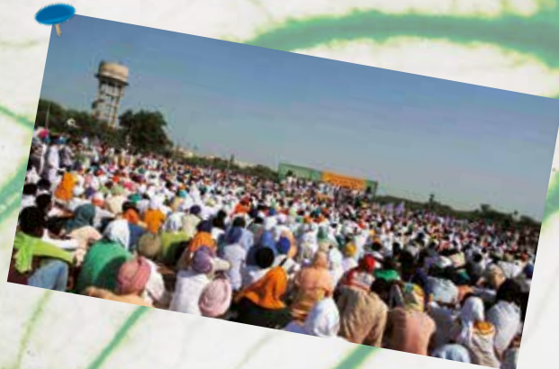
India: la protesta dei contadini - 2020