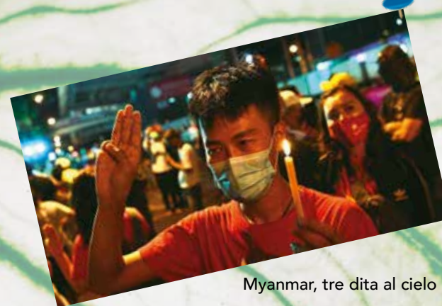
Myanmar, tre dita al cielo per chiedere la libertà