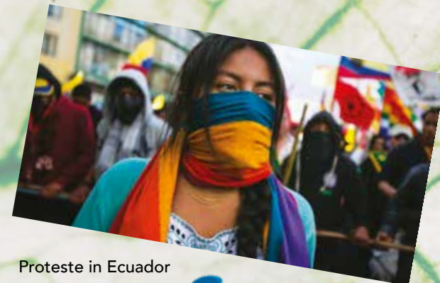
Proteste in Ecuador