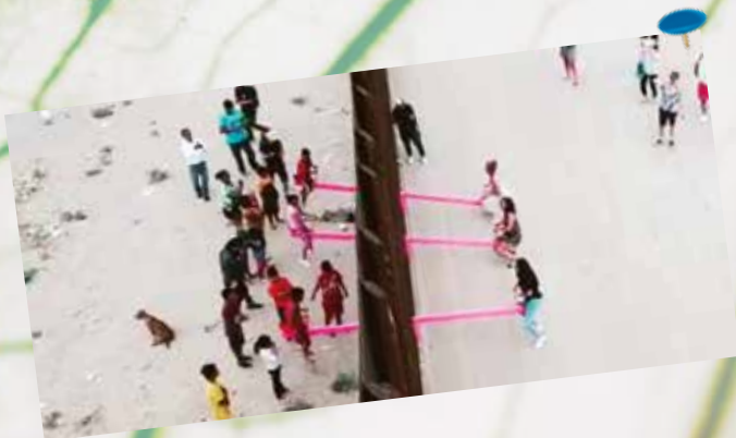
Confine Usa-Messico, le altalene rosa per unire le persone divise dal muro.