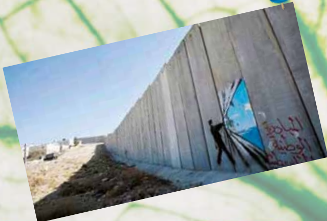
Barriera di separazione israeliana