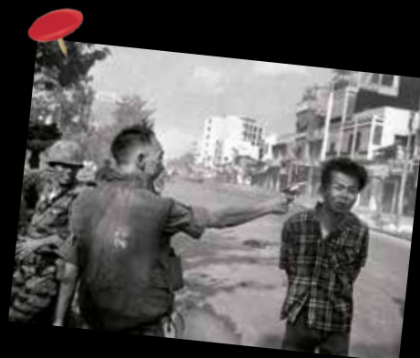
Edward Thomas, ritrae l'esecuzione di un prigioniero Vietcong, Nguyen Văn Lém, da parte del capo della polizia del Vietnam del Sud, il generale Nguyen Ngoc Loan: l'esecuzione avviene il 1° febbraio 1968 a Saigon, in mezzo alla strada.