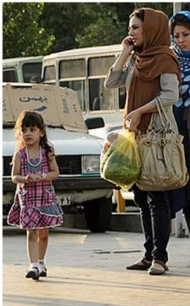
Donne di Tehran (2012)

Proprio per l'emancipazione femminile le autorità hanno inasprito la repressione sulle donne che negli ultimi anni protestano sempre più contro l'obbligo del velo.