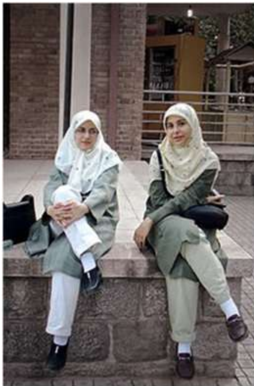
Donne iraniane (2009)

In caso si indossino dei leggings o pantaloni troppo aderenti, le donne optano per indossare delle leggere tuniche che coprano il fondoschiene in modo da non essere richiamate dalla polizia religiosa . Le ragazze però devono ancora coprire i capelli con il velo.