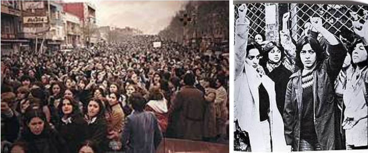
Donne iraniane protestano a Tehheran contro l'obbligo dell'hijab l'8 marzo 1979