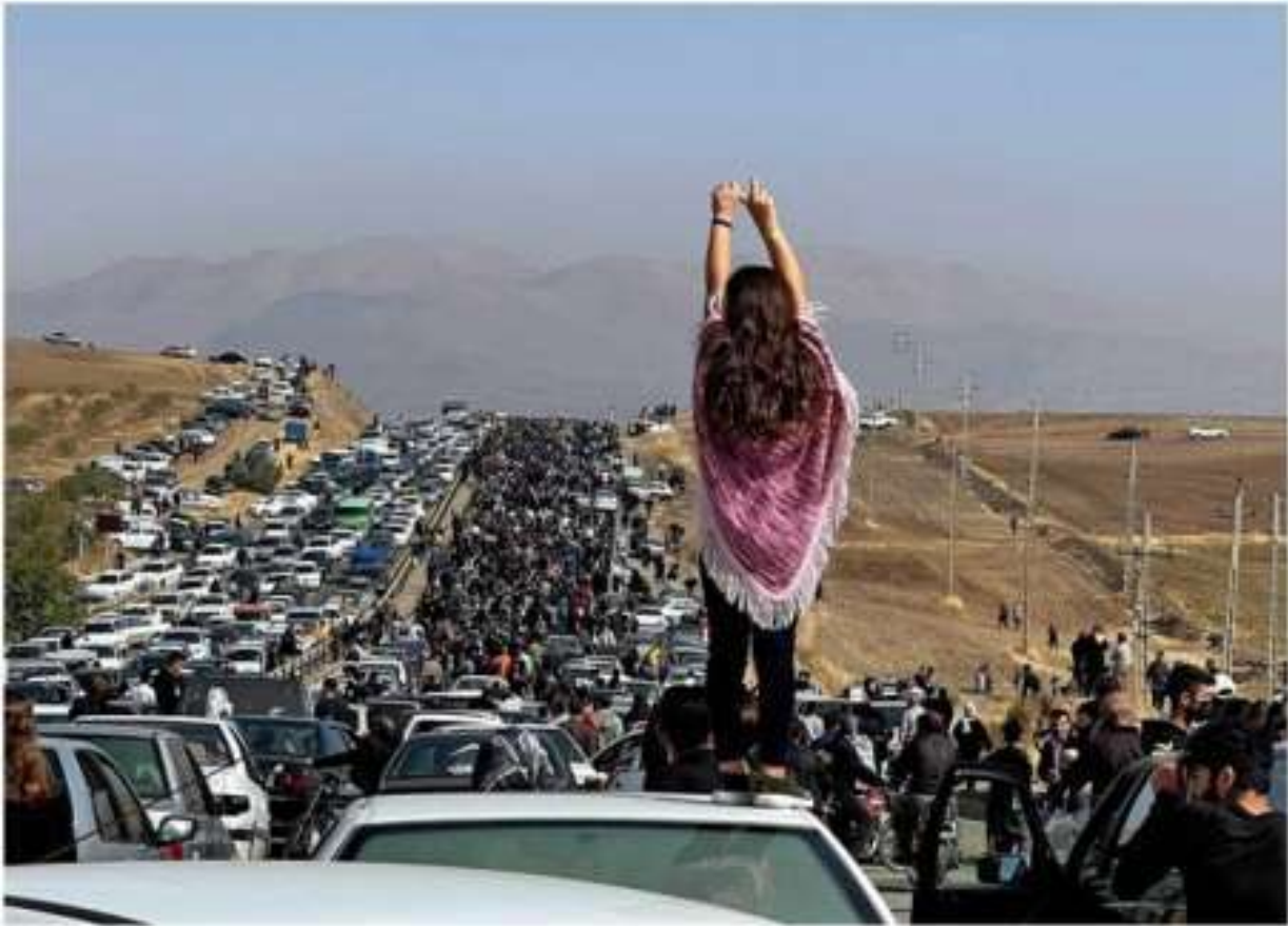
Teheran 26 ottobre 2022