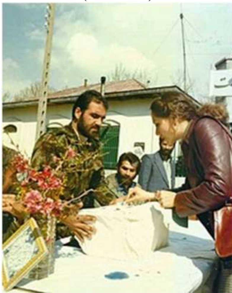
Donna iraniana partecipa al referendum del 30 e 31 marzo 1979