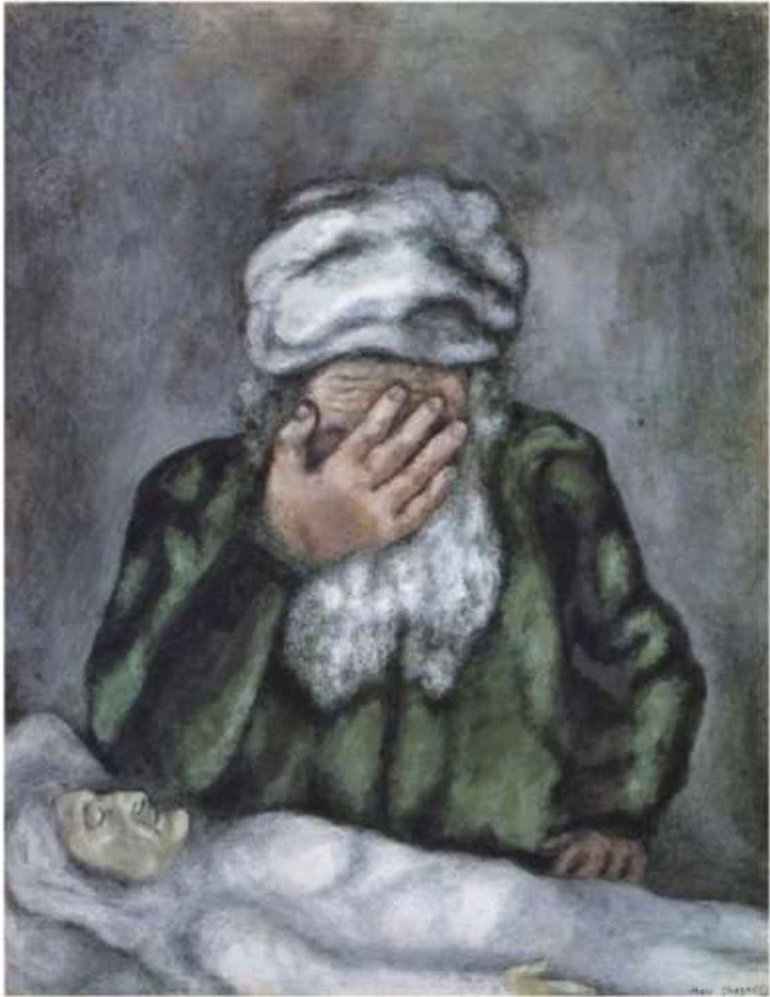
Marc Chagall - Abramo piange Sara - 1931