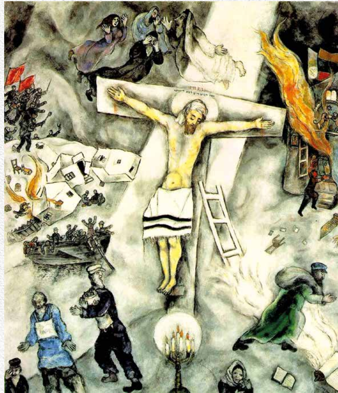
La Crocifissione bianca di Marc Chagall descrisse prima di tante altre opere il dramma degli ebrei in Europa sul finire degli anni Trenta del Novecento.

Il buio su tutta la terra, che, all'ora nona, nel pieno del giorno, il Vangelo fa coincidere con l'ultimo grido di Gesù che muore "Dio mio, Dio mio, perché mi hai abbandonato?" esprime il senso tragico di una domanda che non ha risposta: ci sarà, e quale potrà essere, il futuro di un messaggio che l'alleanza tra il potere religioso e politico aveva voluto spegnere, perché giudicato troppo minaccioso?