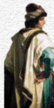
Il giovane ricco