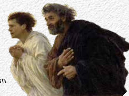
Gli apostoli Pietro e Giovanni corrono al sepolcro.