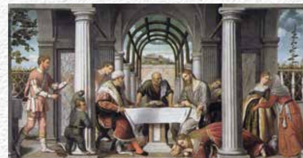
La donna del profumo