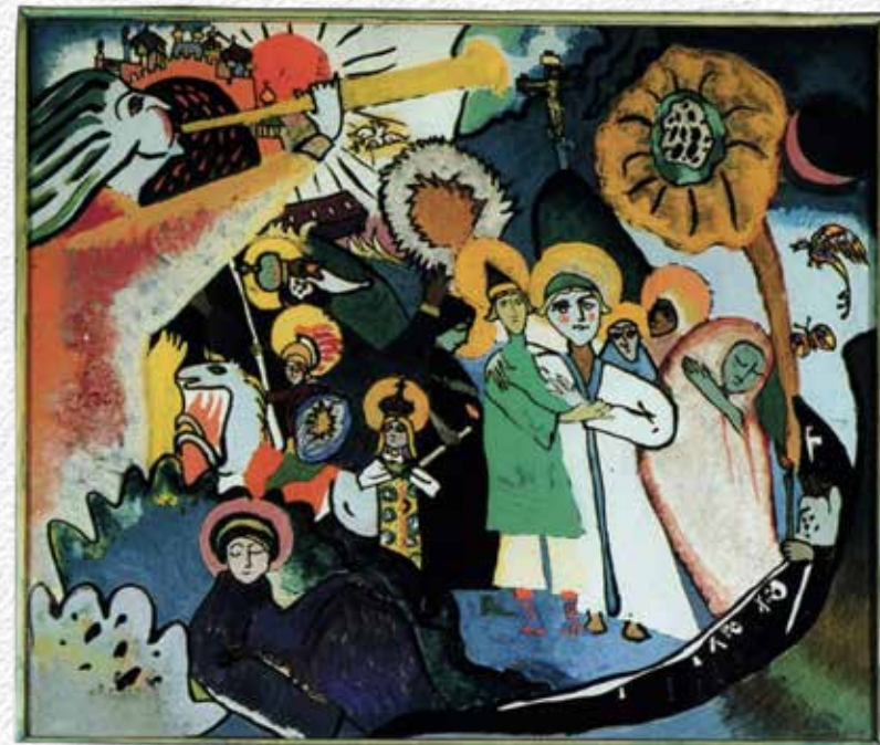
Giudizio Universale con richiami al libro dell'Apocalisse, Wassily Kandinsky, Un possente angelo con la tromba annuncia il Giudizio per tutti; due abbracciati e felici ci guardano dal paradiso svelato dall'azzurro sotto i piedi; altre persone si stanno alzando dal sepolcro; qualcuno è premiato perché ha saputo vegliare (candela accesa)...

e quando vi metteranno al bando e v'insulteranno e respingeranno il vostro nome come scellerato, a causa del Figlio dell'uomo. Rallegratevi in quel giorno ed esultate, perché, ecco, la vostra ricompensa è grande nei cieli. Allo stesso modo infatti facevano i loro padri con i profeti.