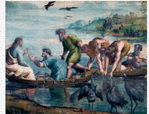
Pesca miracolosa, Raffaello Sanzio