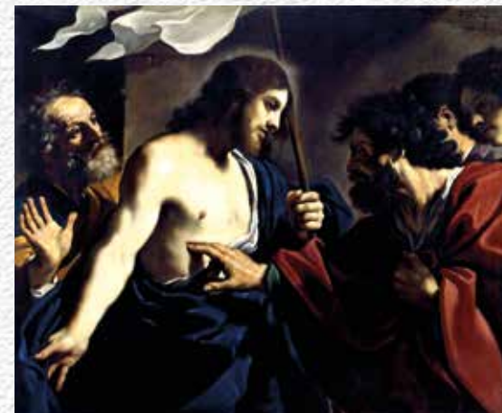
Incredulità di San Tommaso, Guercino (Giovanni Francesco Barbieri)