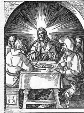
Cristo e i discepoli di Emmaus, Albrecht Dürer

Le pochissime parole di questo Gesù, così riconoscibile, ma così altro, non dicono nulla di nuovo: dicono che tocca a chi crede e ama di andare per tradurre in pratica ciò che hanno visto, sentito, toccato.