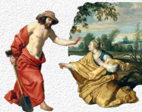
Maria invece stava all'esterno, vicino al sepolcro. Le disse Gesù: «Donna, perché piangi?». Ella, pensando che fosse il custode del giardino, gli disse: «Signore...