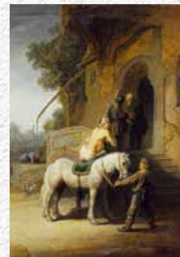
Il buon Samaritano