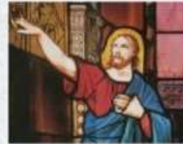
Vetrate del Duomo di Milano