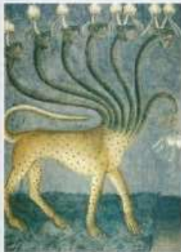
Giusto de Menabuoi