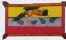
Beato di Liébana