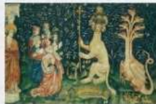
Gli orozzi di Angers