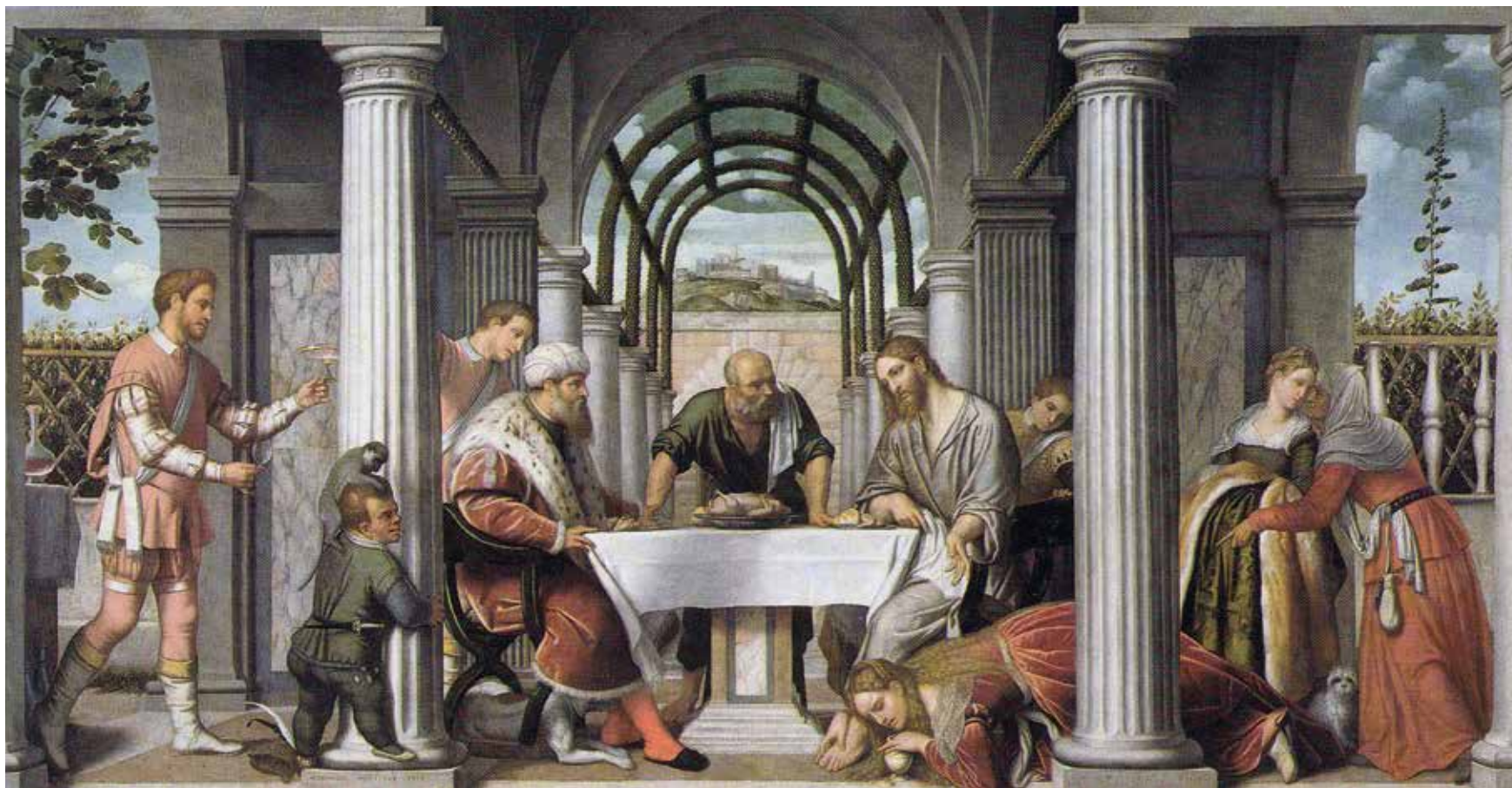
MORETTO DA BRESCIA CENA A CASA DI SIMONE IL FARISEO (1550-1554) - BRESCIA, CHIESA DI SANTA MARIA IN CALCHERA