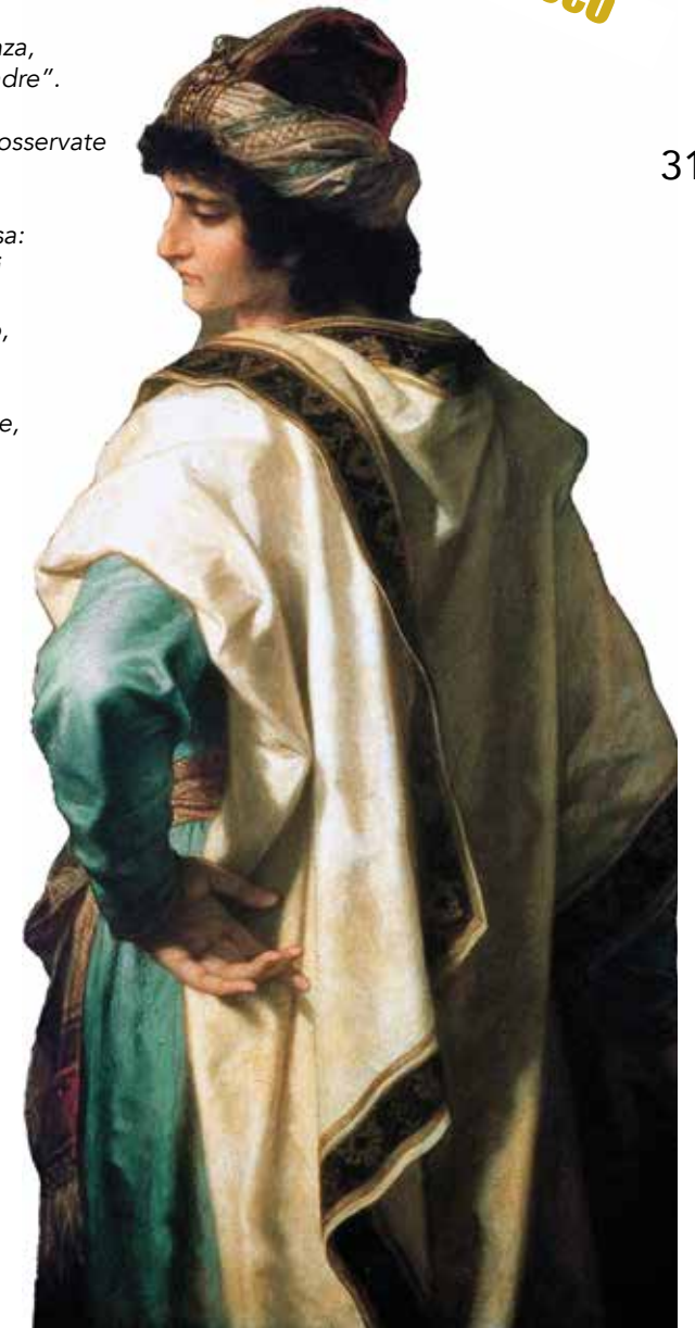
GESÙ E IL GIOVANE RICCO HEINRICH HOFMANN, 1889