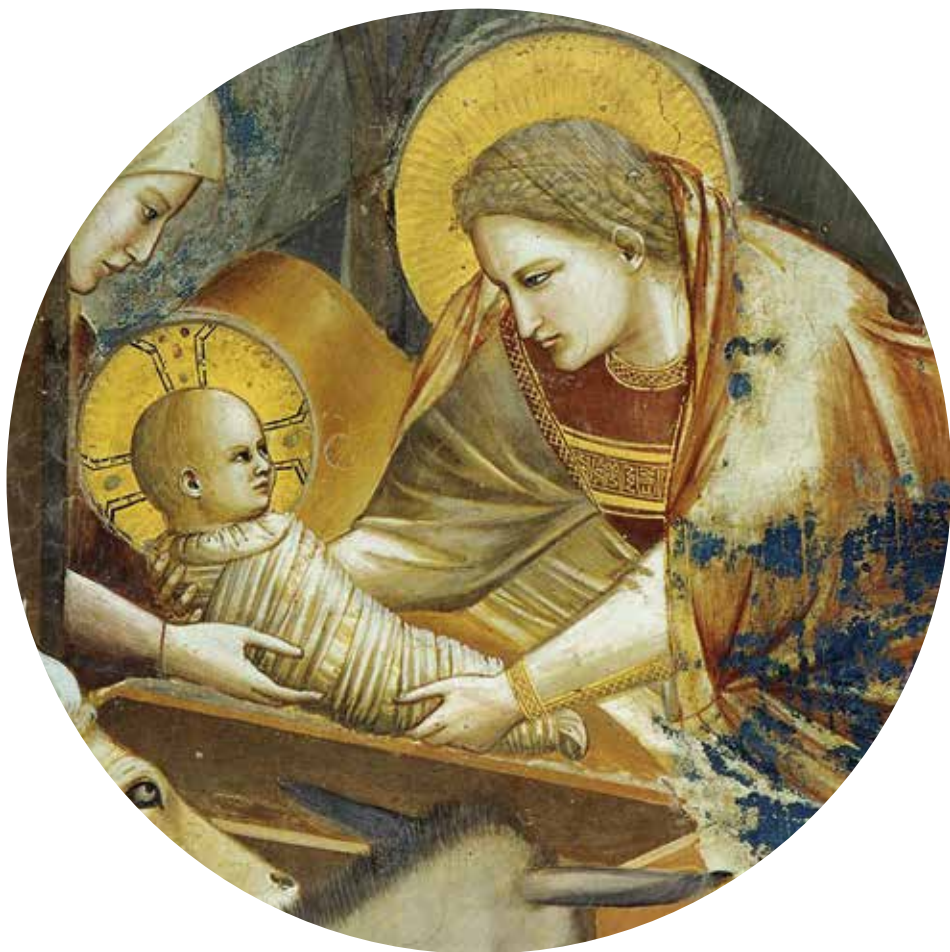
SCENE DELLA VITA DI CRISTO: NATIVITÀ (DETTAGLIO: OSTETRICA SALOMÈ), GIOTTO, TRA IL 1304 E IL 1306, CAPPELLA DEGLI SCROVEGNI - PADOVA