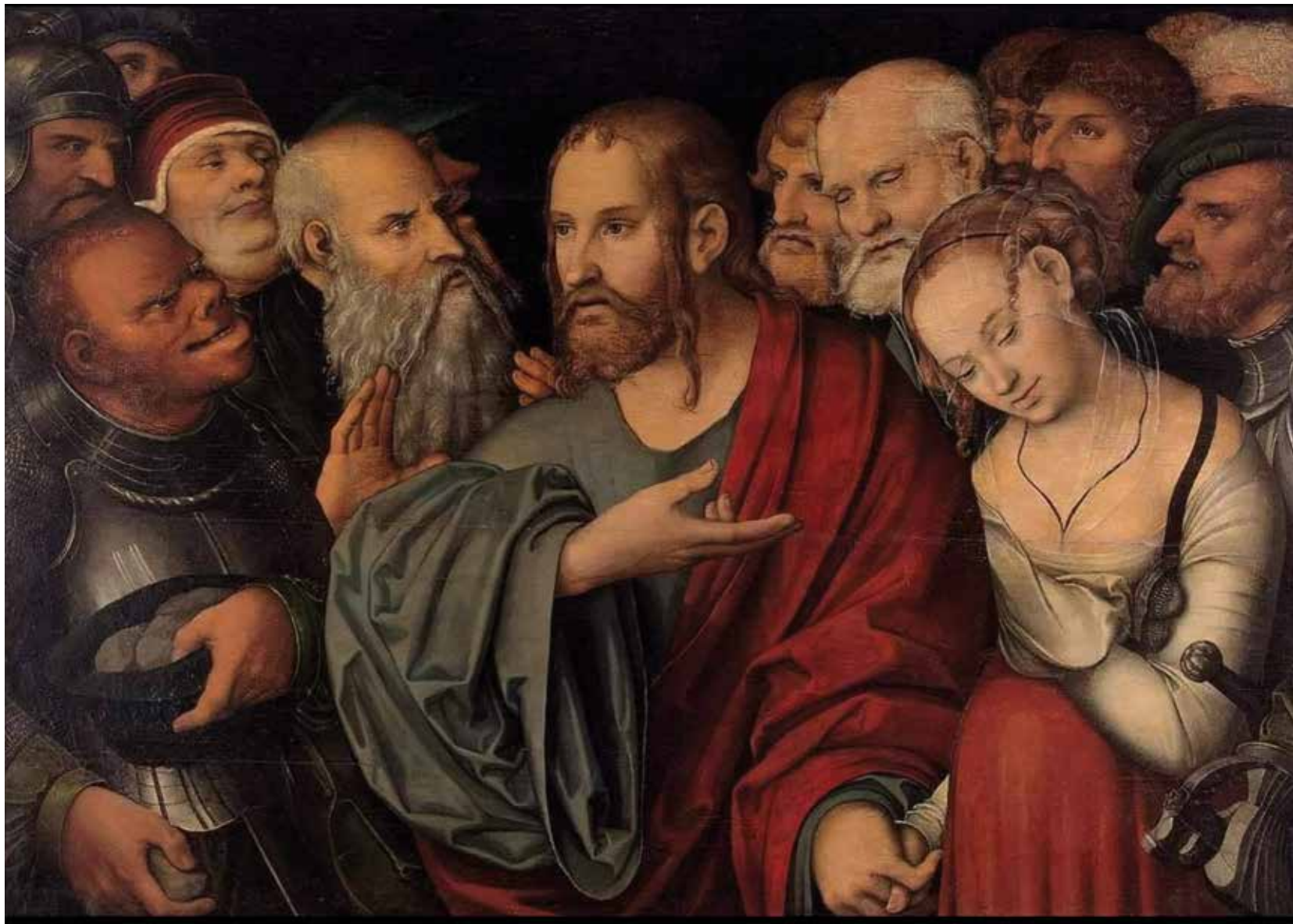
CRISTO E LA DONNA PRESA IN ADULTERIO LUCAS CRANACH IL GIOVANE . DOPO IL 1532

RACCONTO TRATTO DAL VANGELO DI GIOVANNI (8, 3-11)