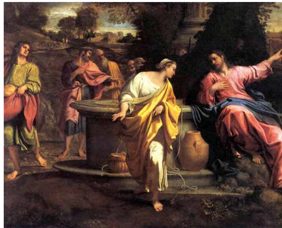
CRISTO E LA SAMARITANA - ANNIBALE CARRACCI - SECONDA METÀ DEL XVI SECOLO