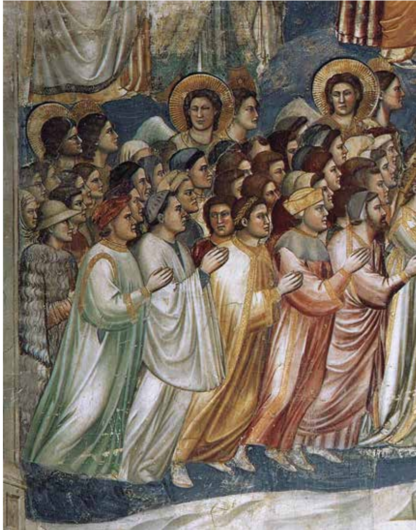
Il Giudizio universale (dettaglio), Giotto di Bondone, Cappella degli Scrovegni - 1304

Quando il Figlio dell'uomo verrà nella sua gloria con tutti i suoi angeli, si siederà sul trono della sua gloria. E saranno riunite davanti a lui tutte le genti, ed egli separerà gli uni dagli altri, come il pastore separa le pecore dai capri, e porrà le pecore alla sua destra e i capri alla sinistra.