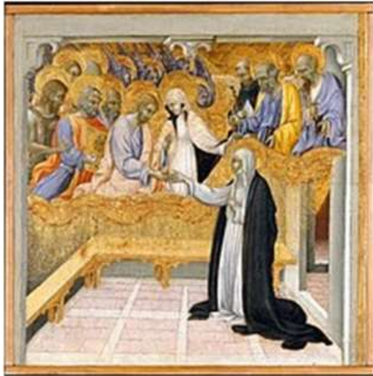
Le nozze mistiche di Caterina da Siena , 1460, di Giovanni di Paolo

appropriata di territori del dominio della chiesa. E questa ragazza di Siena dice: ‘Ma perché la Chiesa deve perdersi dietro questo discorso di cose quando il suo è il discorso dell’uomo, quando lei deve ricordare semplicemente due cose: Sangue e Fuoco, cioè le due realtà che sono dentro di noi come uomini-donne e come cristiani redenti dall’amore di Dio in Cristo