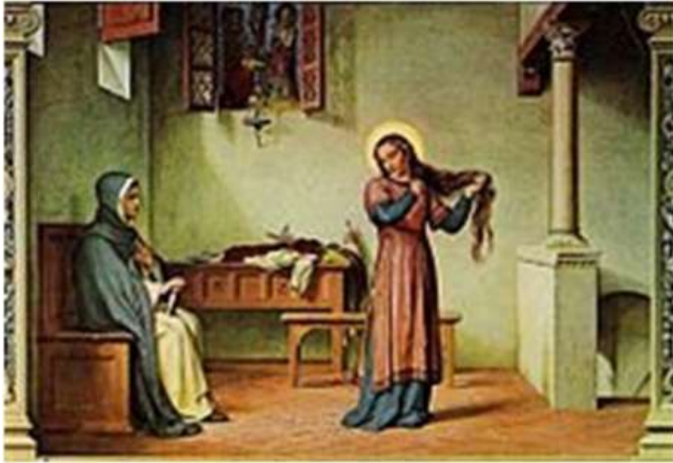
Caterina si taglia i capelli alla presenza di fra Tommaso della Fonte

che era stato invitato da Lapa per dissuadere la figlia dai sogni infantili in cui credeva visse.