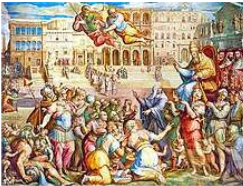
Caterina da Siena accompagna a Roma papa Gregorio XI , 17 gennaio 1377, affresco di Giorgio Vasari (1511-1574).