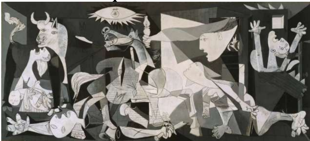
Pablo Picasso, "Guernica".