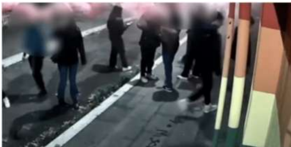
Il gruppo di giovanissimi mente prende d'assalto il Gay Center del quartiere Testaccio, a Roma

Bastonate contro le porte d'ingresso e scritte omofobe su muri e marciapiedi. E' solo l'ultimo episodio di violenza di un gruppo di giovanissimi che ha preso d'assalto il Gay Center del quartiere Testaccio, a Roma.