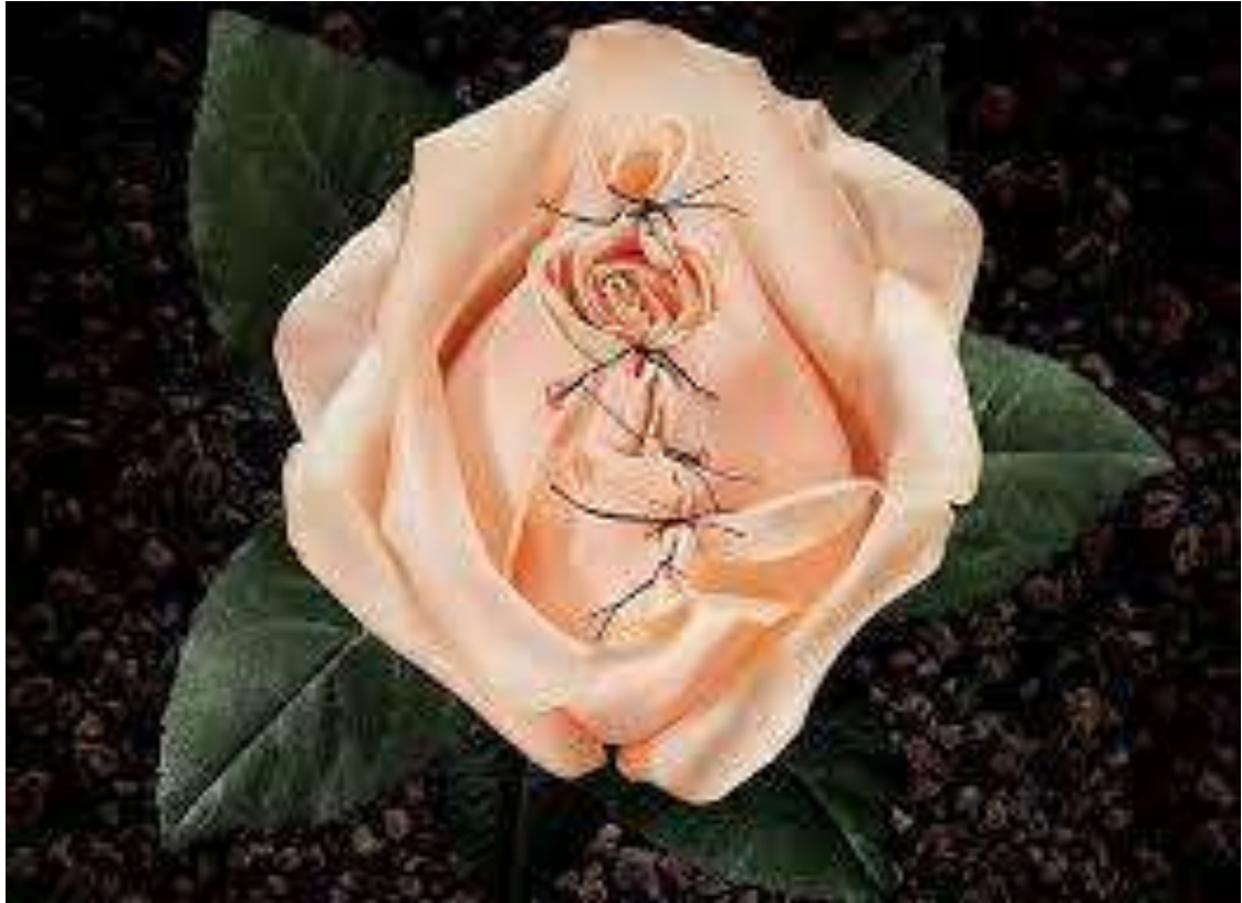
Storia della ragazza Masai che lotta contro le infibulazioni