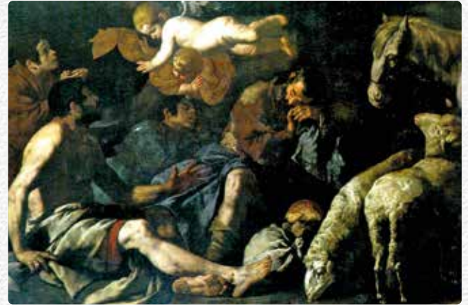
Disorientamento tra i pastori all'annuncio degli angeli

La pace-nome-di-dio, non è qualcosa che si predica: è una ricerca collettiva, difficile, da sperimentare.